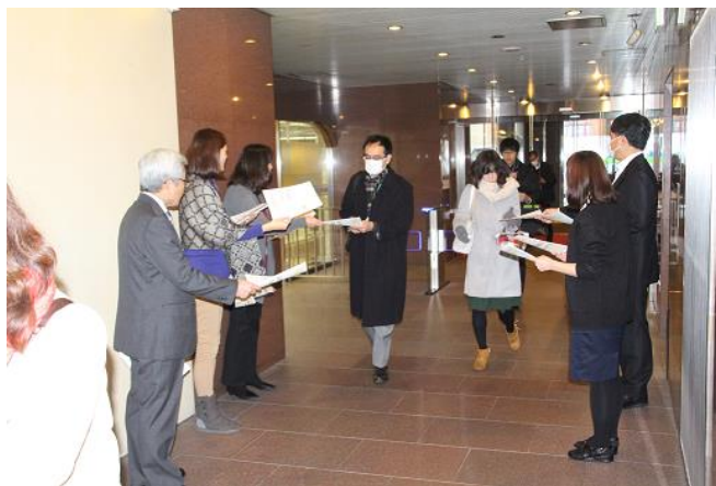
社員に朝ピラを配布するボランティア推進チーム

集まった募金は毎年、NGO「マザーランド・アカデミー・インターナショナル」を通じて、西アフリカ・マリ共和国の難民支援のために活用されています。1993年に開始されて以来途絶えることなく続けられ、今年で26年目を迎えました。