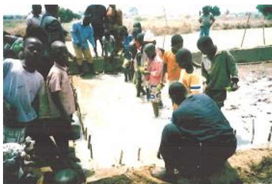
水田づくりの様子(マリ共和国)