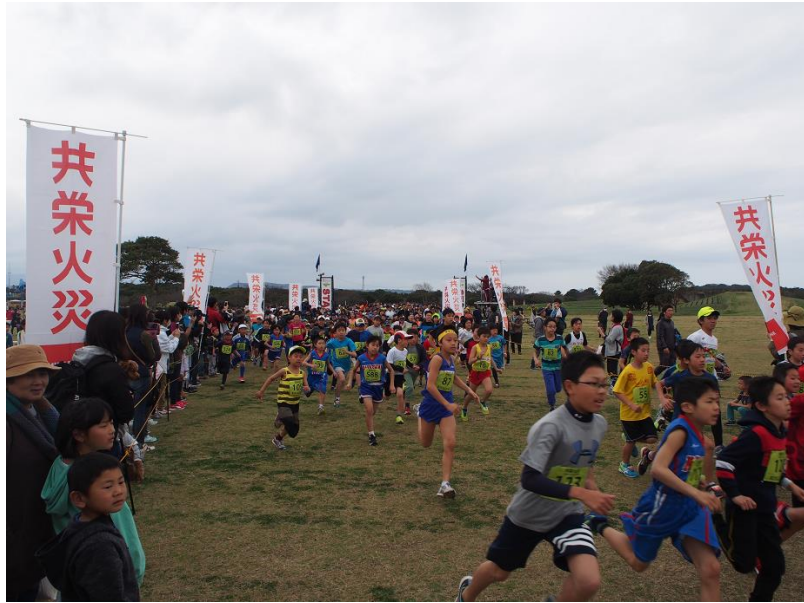
海の中道海浜公園を激走する子どもたち