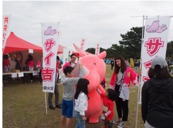
子どもに大人気の「サイ吉」