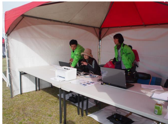
安全運転適正診断にチャレンジする参加者