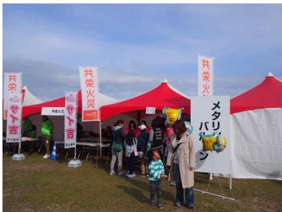
キャラクターバルーンのチャリティ販売の様子